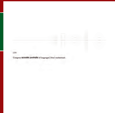
Alessandro Bosetti: Exposé 14 (2007)