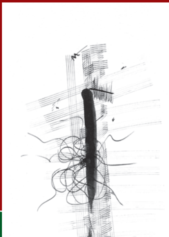
Franz Hautzinger: Bildhören I (2000)